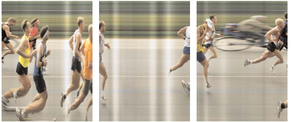
"o.T. (Läufer I)"

2003, Farbfotografie 30 x 150 cm, gerahmt