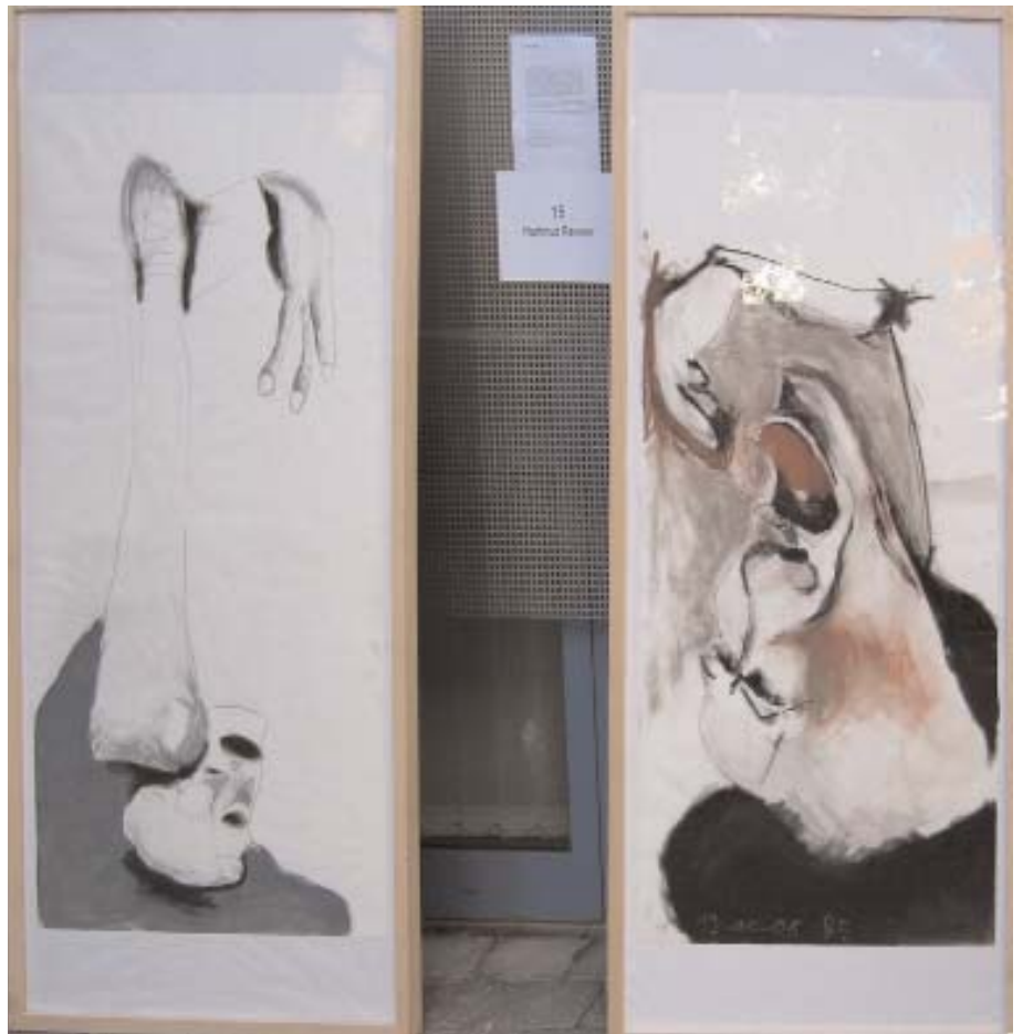
"Nathanael" und "Coppelius"