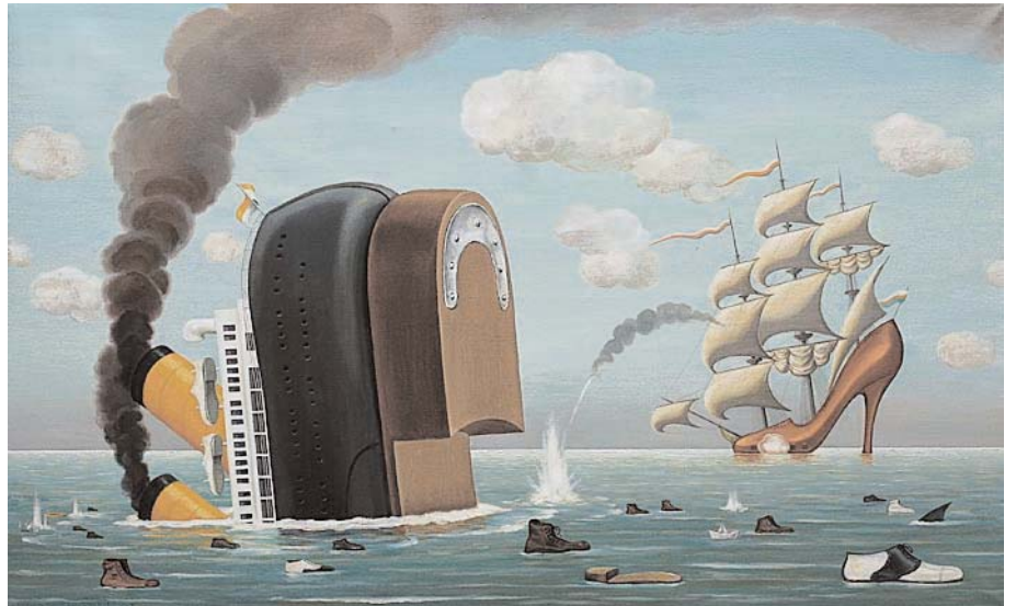
“Sieg - Niederlage”