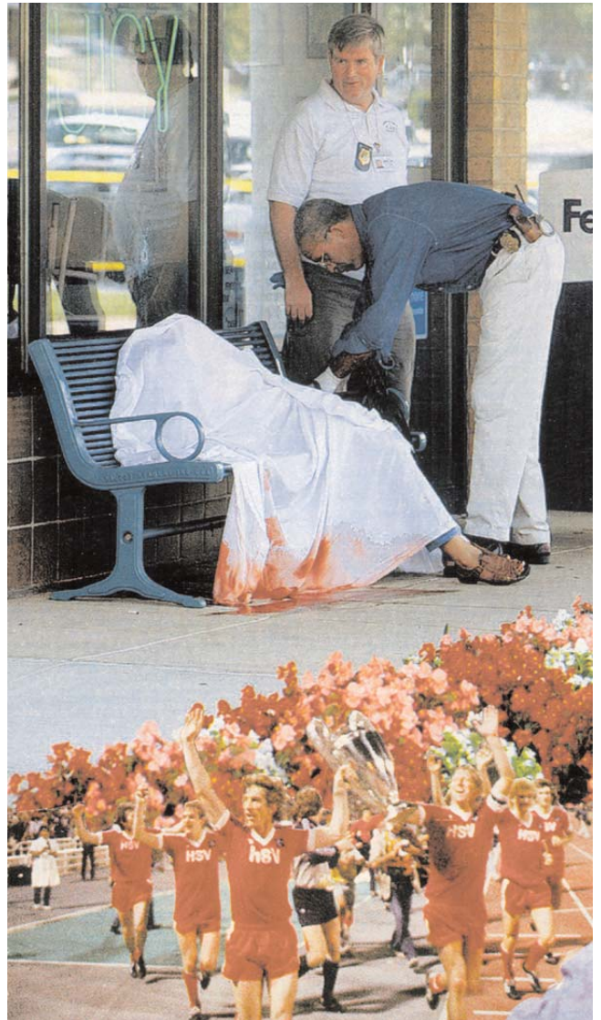
"Sieg - Niederlage"

Montage, digitaler Druck auf Dibond 55 x 96 cm