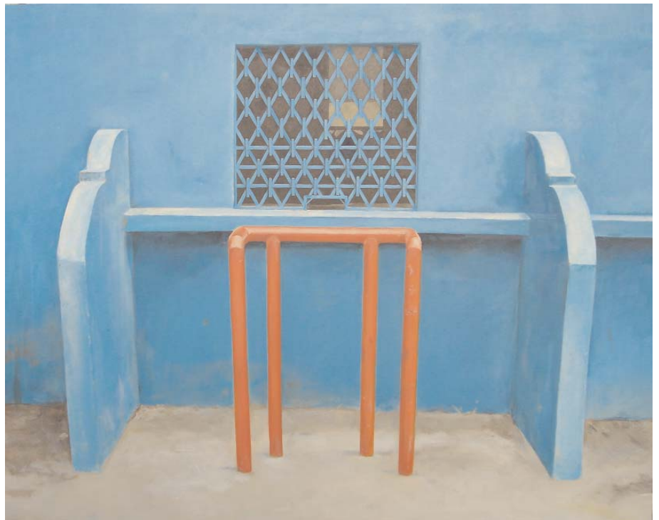
“Gewinn und Verlust”