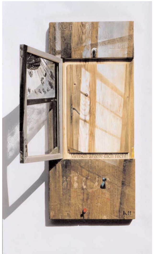
kein Tag mehr ohne "Mensch ärgere dich nicht"

Bildmontage, Schwenkrahmen (Alu) in Fundholz, Zeitung, Zeichnung, Stempel, Spielfigur