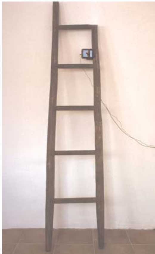
"Sieg - Niederlage"